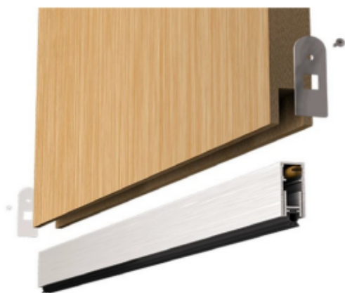
Exemplo de veda porta inferior.