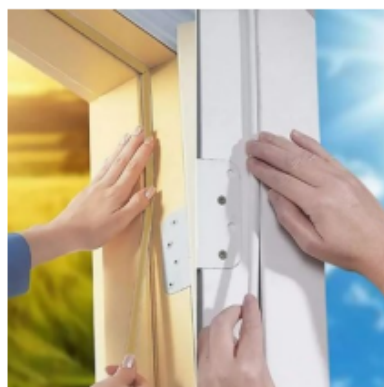
Exemplo de fita veda frestas. Instalar no perímetro dos batentes.

7.3 Forro de gesso com isolamento termo acústico: Sob o forro de PVC existente, e apenas na Sala de Atendimento Psicológico, será executado forro em chapas de gesso do tipo fixo e monolítico com isolamento entre as camadas de forro em manta de lã de pet de mesma especificação das paredes. Todos os procedimentos devem ser realizados rigorosamente de acordo com a NBR 15758-2/2009 e demais normas correlatas.