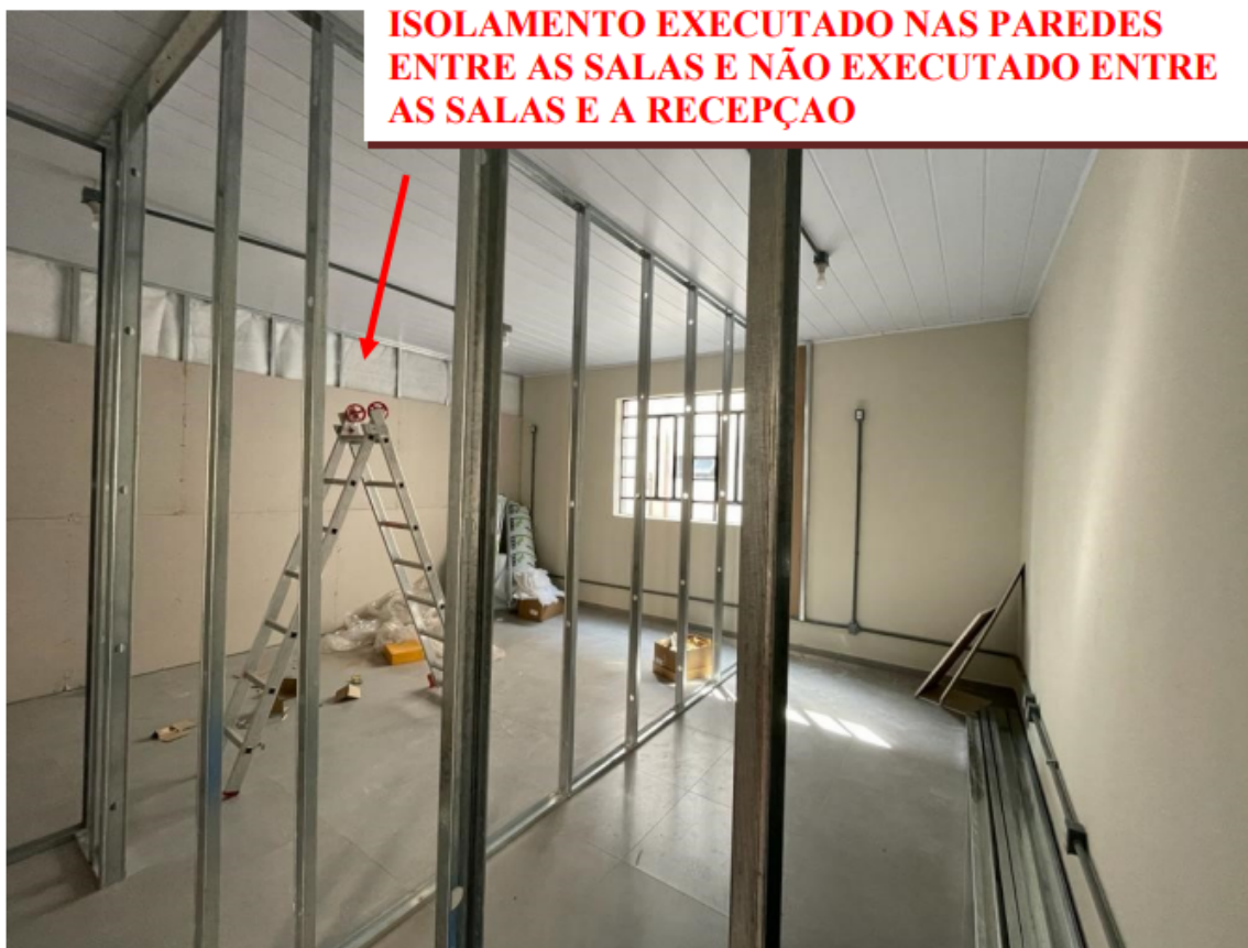
ISOLAMENTO EXECUTADO NAS PAREDES ENTRE AS SALAS E NÃO EXECUTADO ENTRE AS SALAS E A RECEPÇÃO

7.2 Portas maciças: Nas duas salas deverão ser instaladas portas com folhas maciças, com acabamento melamínico branco, com vedação nas frestas em todo perímetro dos batentes e veda porta inferior. A especificação do veda frestas fica a cargo da empresa, sob aceitação prévia da fiscalização, cujo dimensionamento deve ser de acordo com os vãos resultantes após a instalação das folhas das portas. O veda porta inferior deverá ser, preferencialmente, embutido na folha, e possuir acionamento automático no fechamento da porta. Deverá ser mantido o mesmo padrão de fechadura das portas existentes.