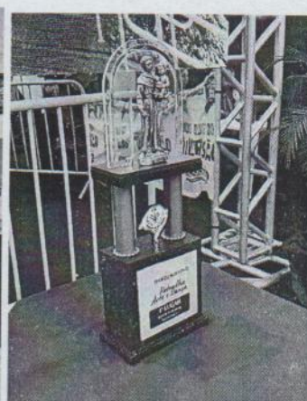
Gaúchos de Pé, Defendendo Nosso Chão